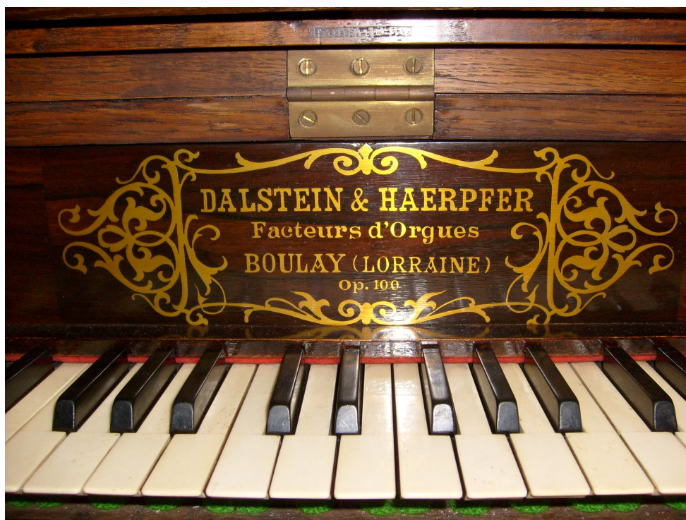
Plaque d'adresse de l'opus 100.